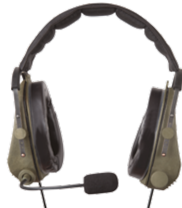
Arceau de tête